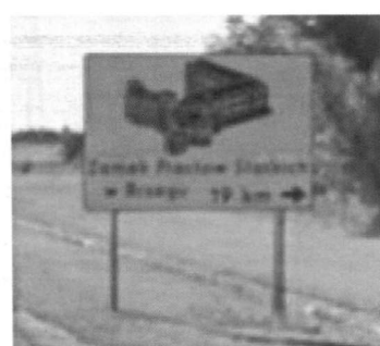
Figura 1: BRZEG

Zamek Piastowski w Raciborzu nie ma jeszcze godnej reklamy w postaci zwykłych dużych znaków drogowych (nie są to bilbordy) o symbolu np.E-22c. Te znaki drogowe pełnią przede wszystkim funkcję informacyjną, gdyż stanowią wskazówkę dla podróżnych, jakie miejsca i obiekty znajdujące się w okolicy ich przejazdu warto zwiedzić. Jednocześnie stanowią element promocji danego obiektu, miasta czy miejsca. W załączeniu przykładowe znaki