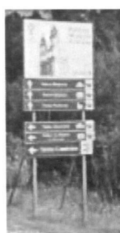
Figura 2: KRZESZÓW