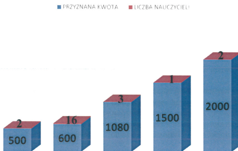
Schemat nr 1

Wysokość środków przeznaczonych dla nauczycieli na pomoc zdrowotną - lata 2011 – 2021 przedstawia schemat nr 2: