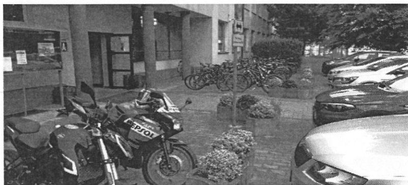
Figura 3: Centrum Kształcenia Zawodowego i Ustawicznego Nr 2 "Mechanik" w Raciborzu