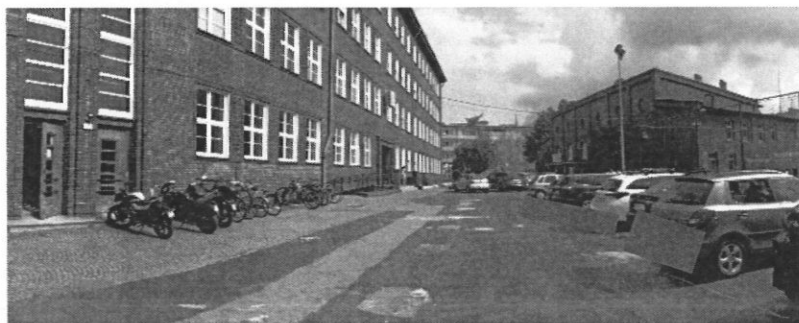
Figura 2: Centrum Kształcenia Zawodowego i Ustawicznego Nr 1 w Raciborzu