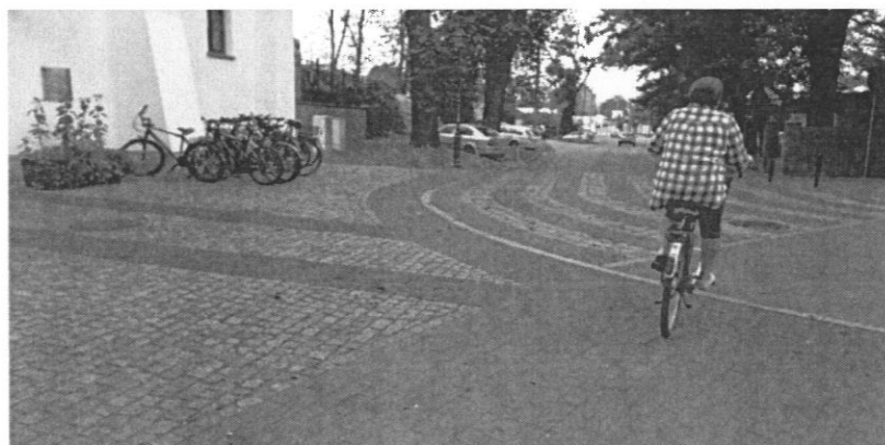
Figura 4: Zamek Piastowski w Raciborzu obok CKZiU Nr 2 "Mechanik" w Raciborzu.