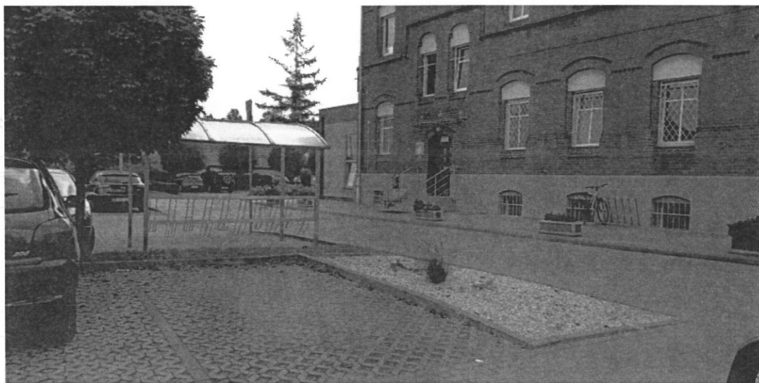
Figura 8: Starostwo Powiatowe w Raciborzu