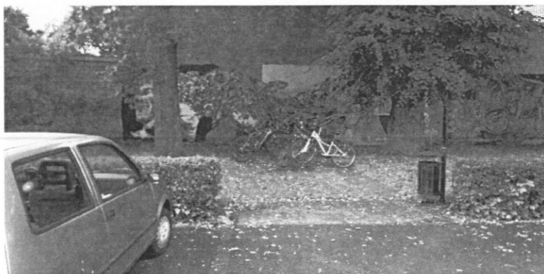
Figura 6: II Liceum Ogólnokształcące im. Adama Mickiewicza w Raciborzu