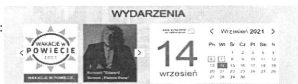
Figura 1: https://www.powiatraciborski.pl/ ( Kalendarz - dn. 13.09.2021r. Godz.23:00), Brak imprez na dn. 17.09.2021r.