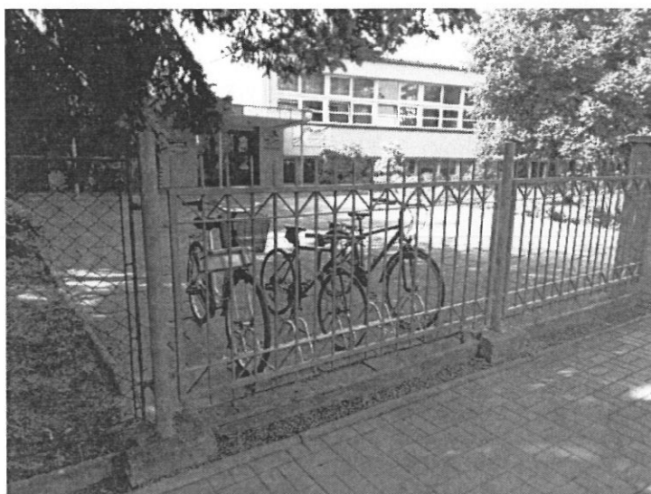
Figura 7: Zespół Szkół Specjalnych w Raciborzu