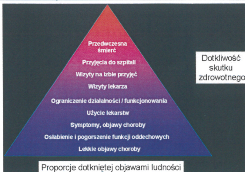
Rysunek 1 Piramida skutków zdrowotnych związanych ze wzrostem narażenia na zanieczyszczenie powietrza.