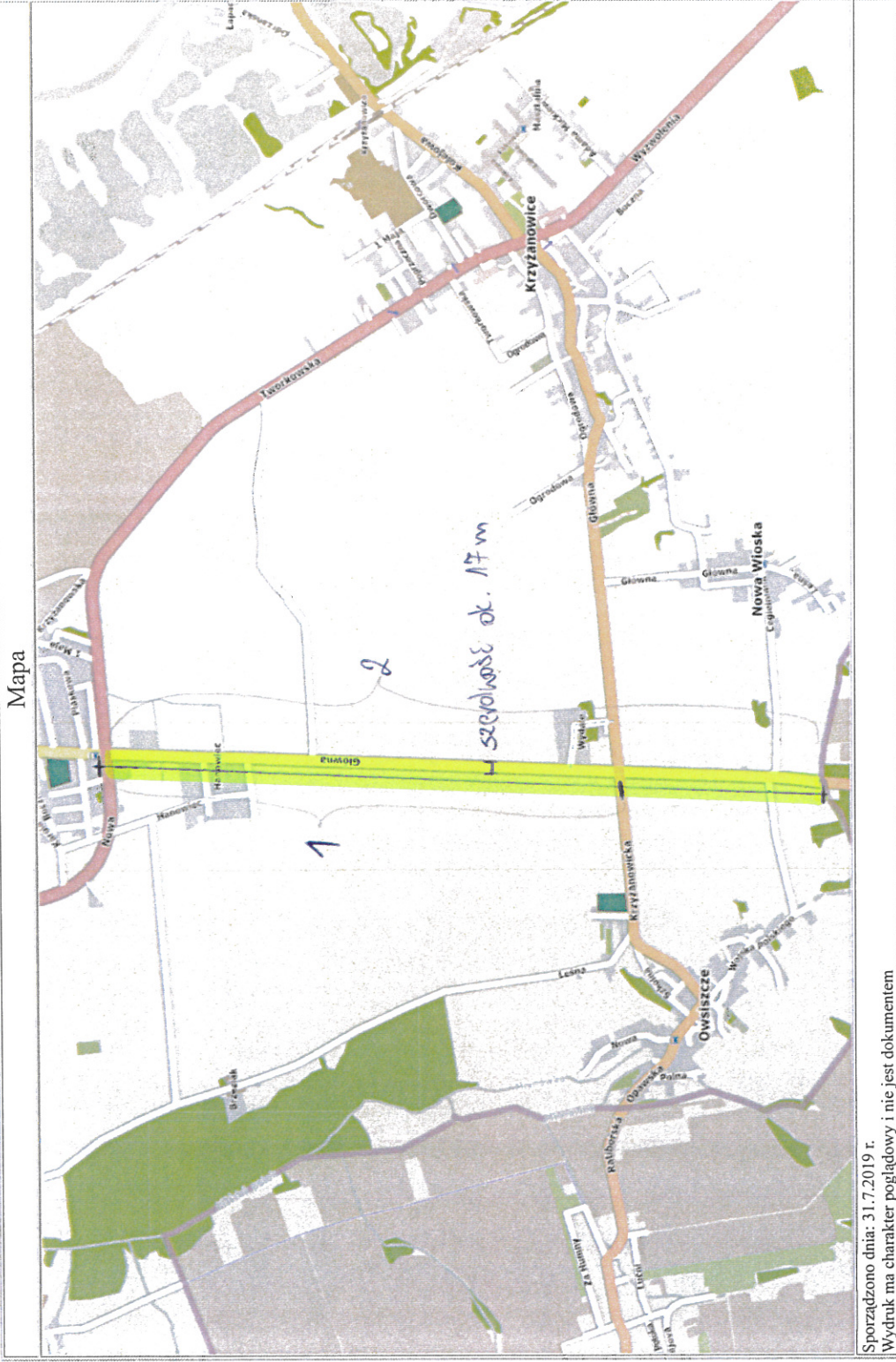
Sporządzono dnia: 31.7.2019 r. Wydruk ma charakter poglądowy i nie jest dokumentem