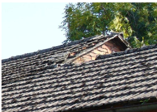
spadające dachówki i gąsiory