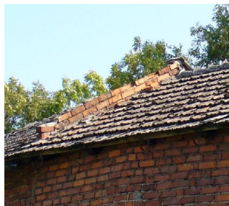
luźne cegły ogniomuru